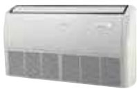
Chão Teto FDMX 50/70