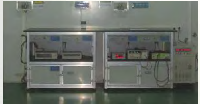
Sala de Inspeção e Controlo de Qualidade