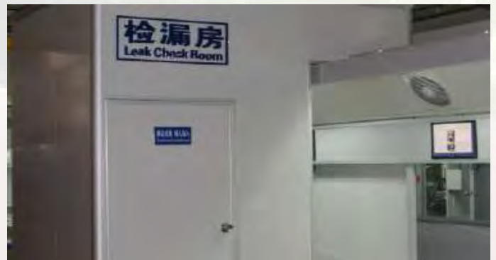
Sala de Verificação de Fugas