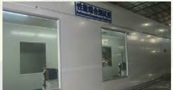
Sala de Testes de Performance