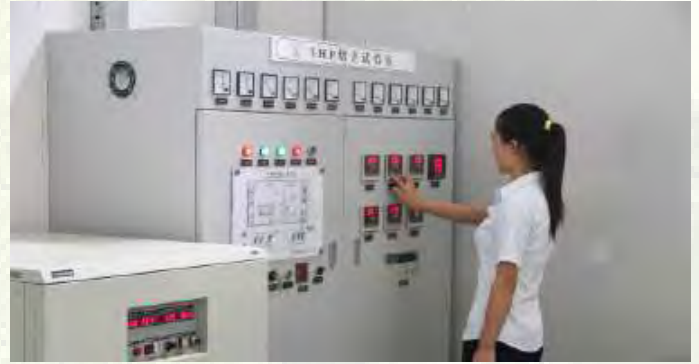
Sistema de Laboratório Termodinâmico