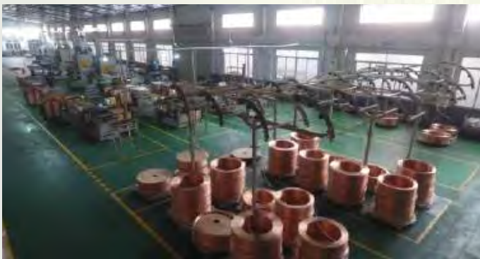
Sistemas Condensadores & Evaporadores