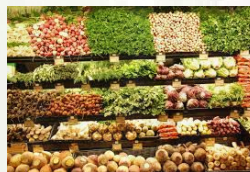
Preservação de Alimentos