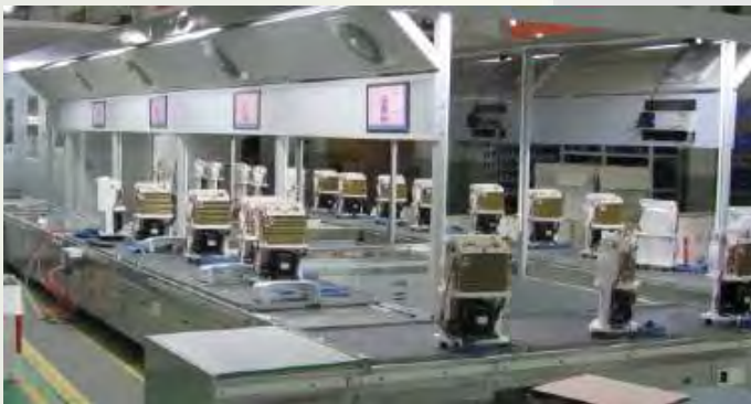
Linha de Produção