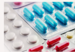
Preservação de Medicamentos