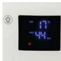
Visor LCD com indicação do nível de humidade relativa e temperatura ambiente.