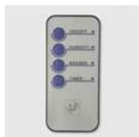
Comando à distância.