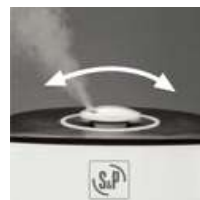
Difusor de nebulização orientável a 360°.