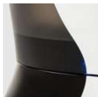
Visor de nível de água.