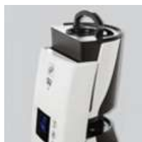
Depósito extraível de 4,7 litros.